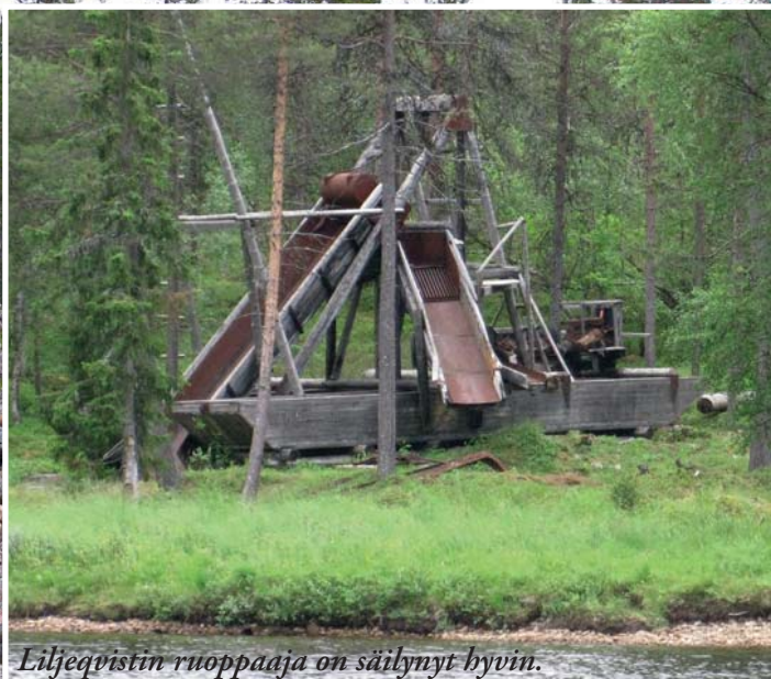
Liljeqvistin ruoppaaja on säilynyt hyvin.