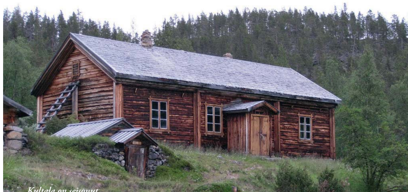
Kultala on seisonut jykevästi paikal- laan 140 vuotta.