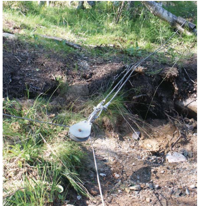
Kytke vinssi ja hinattava kohde aina epäsuorasti rissapyörän kautta.