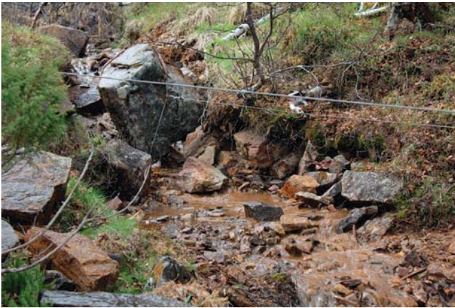
Isokin kivi liikkuu pyörittämällä.

Vinssauksessa kaikkein tärkeintä on työturvallisuus. Uusi heti vaijerit, joiden säikeitä on poikki. Varmista myös, että vaijerin vetolujuus on suurempi kuin vinssin vetokyky. Kytke hinattava kohde aina epäsuorasti vinssiin.