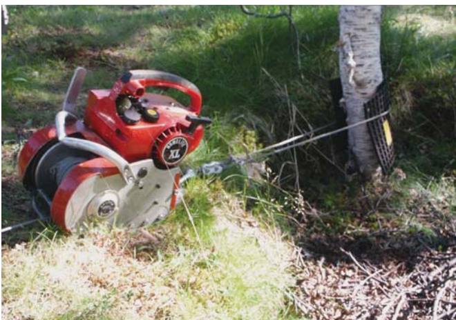
Kiinnitä vinssi tukevasti puun runkoon tai kiveen.