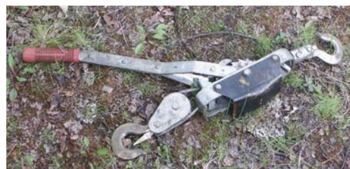
Käsikäyttöinen vinssi on käyttökelpoinen isojen kivien siirtoon.